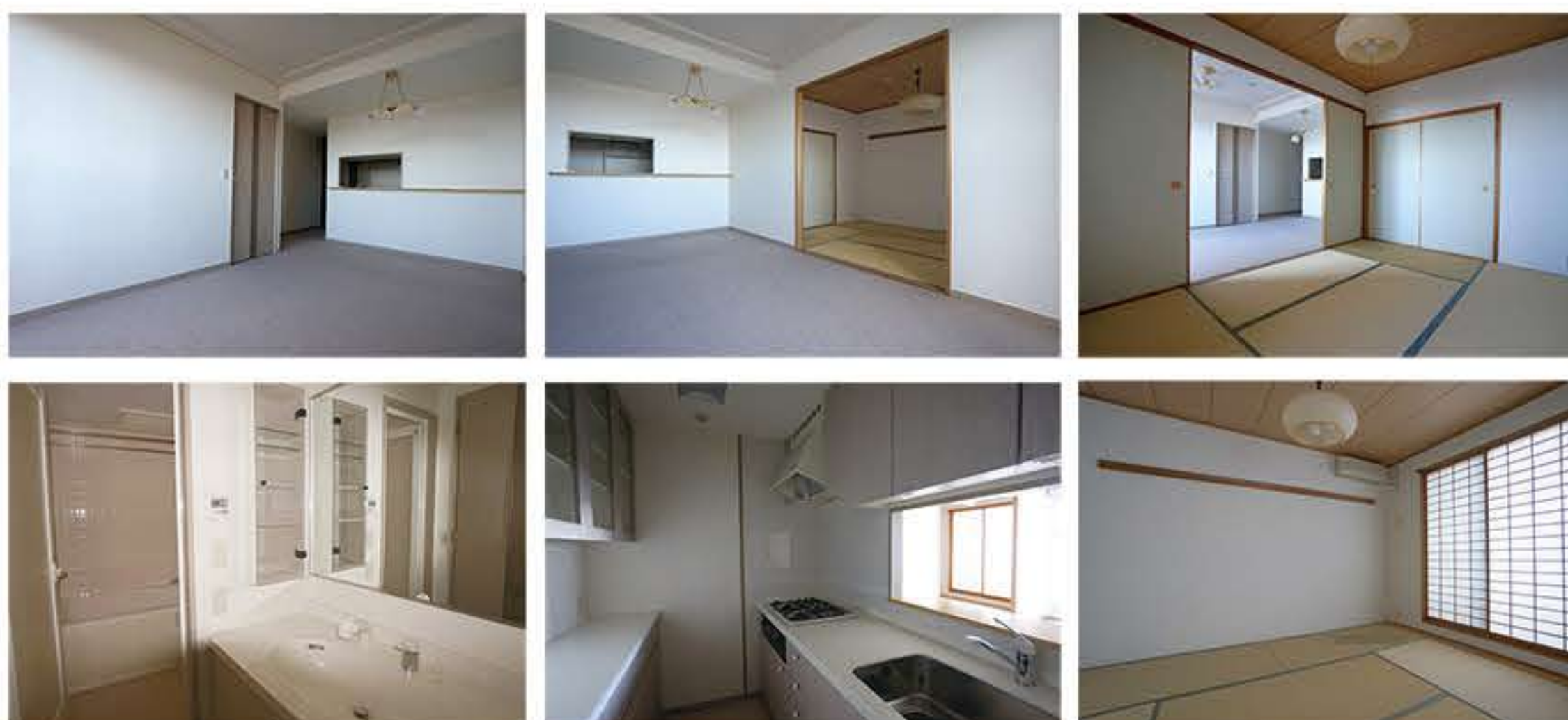
室内画像は棟内・同じ間取りのお部屋のものです（1008号室ではありません）